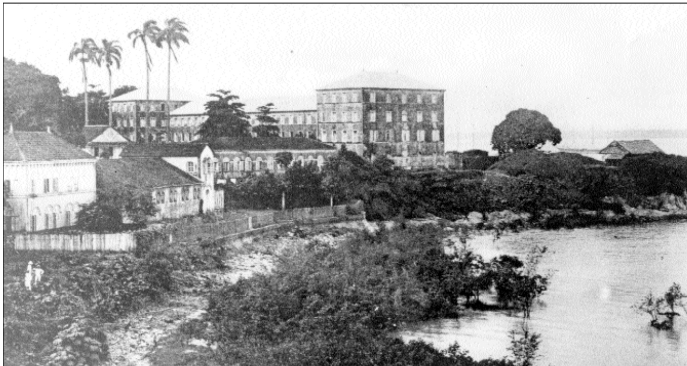
Cayenne (Guyane). Panorama de la caserne d'Infanterie Coloniale.

« L 'infirmière, sous sa blouse blanche qui déjà me sembla très sexy, avait une peau noire et parlait avec un accent créole. Dans la chambre, la chaleur était considérable, étouffante et moite. Derrière la fenêtre, à l'extérieur, j'apercevais une végétation luxuriante et multicolore, les larges feuilles de teks, les palétuviers dont les racines sont en échasses. »